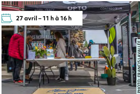
27 avril – 11 h à 16 h